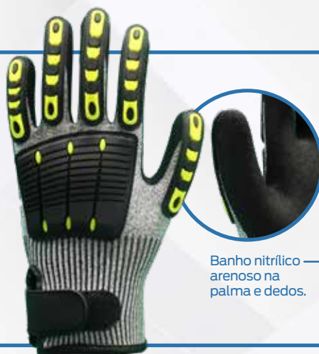
Banho nitrílico arenoso na palma e dedos.